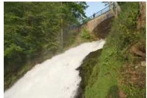
Waterval van Coo

Daarna is een rustige wandeling gepland, alles bij mooi weer. Op amper 15 minuten wandelen staan we oog in oog met de waterval van Coo. Op zijn Frans geschreven is dat Val de la Cascade. Dat is een toplocatie om de omgeving in je op te nemen. Er is nog een topattractie te zien. De waterspreeuw maakt zijn vlucht over de waterval. We zien hem op en neer vliegen, maar zijn nestje toch niet.