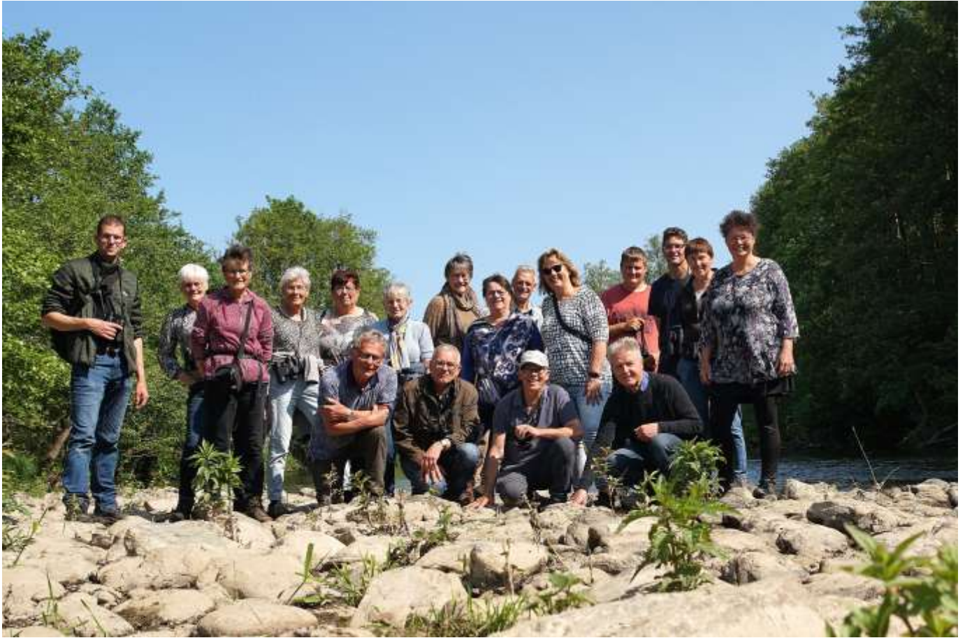
Pinksterweekend 2023: "tableau de la troupe"